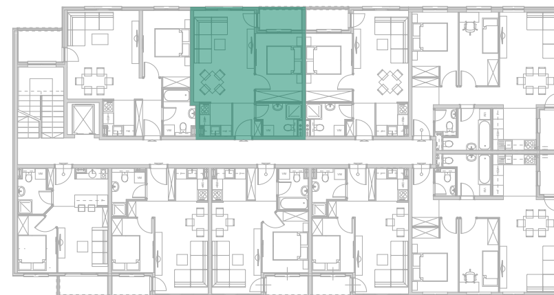
Položaj stana - I SPRAT