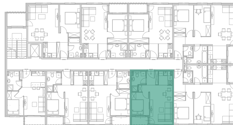
Položaj stana - II SPRAT

investitor: INOBAČKA d.o.o. Novi Sad objekat: Stambena grada P+4+Pk(dupleks) lokacija: Bate Brkića 2A