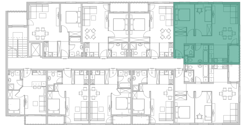
Položaj stana - II SPRAT