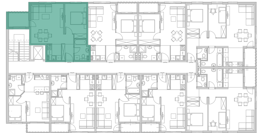
Položaj stana - I SPRAT