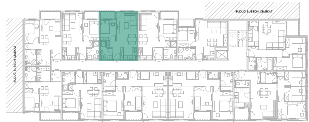
Položaj stana - I SPRAT