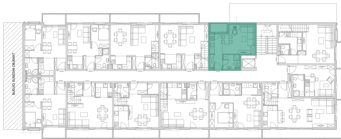
Položaj stana - potkrovlje donji nivo