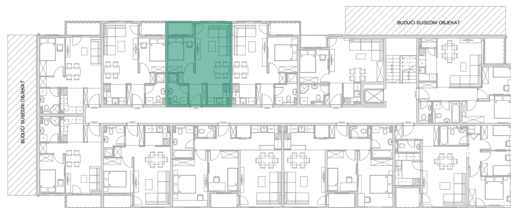
Položaj stana - V SPRAT