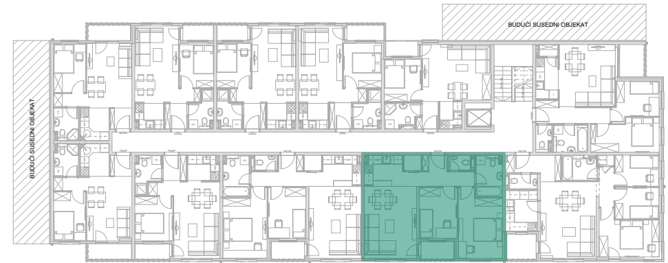
Položaj stana - V SPRAT

investitor: INOBAČKA d.o.o. Novi Sad objekat: Stambena grada P+5+Pk(dupleks) lokacija: Bate Brkića 2