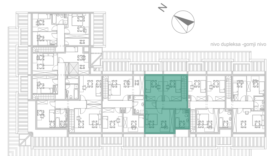
Ul. Bate Brkića