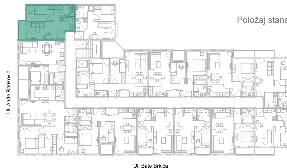
STAN tip 2 (2, 15, 28, 41, 54)