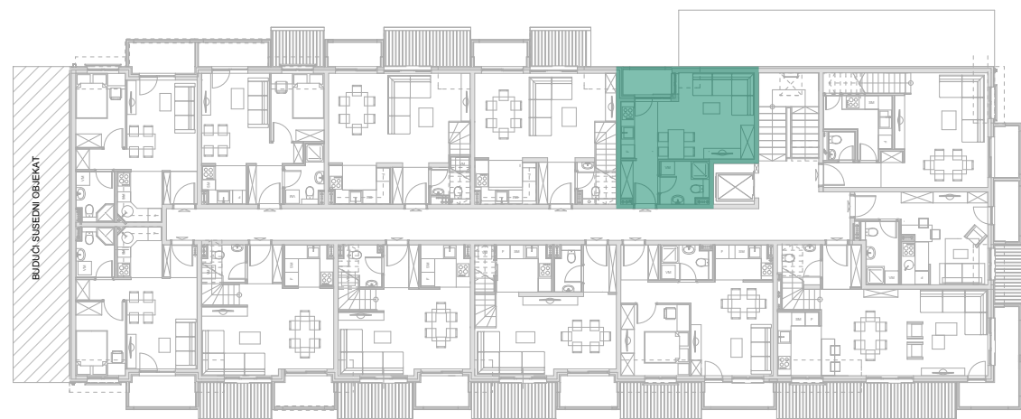
Položaj stana - potkrovlje donji nivo