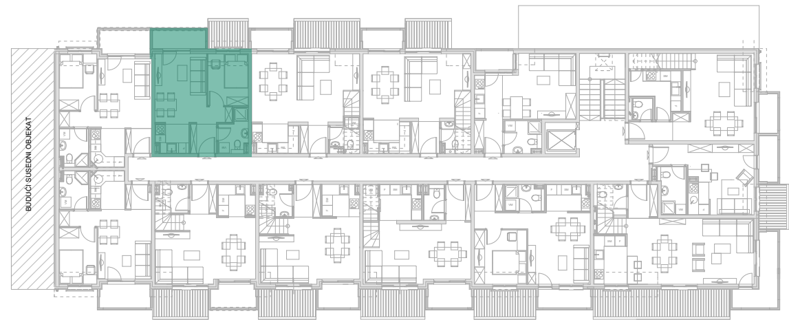
Položaj stana - potkrovlje donji nivo