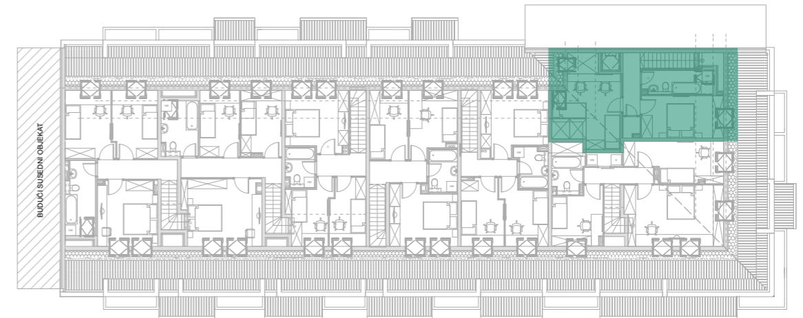
Položaj stana - potkrovlje gornji nivo (dupleks)