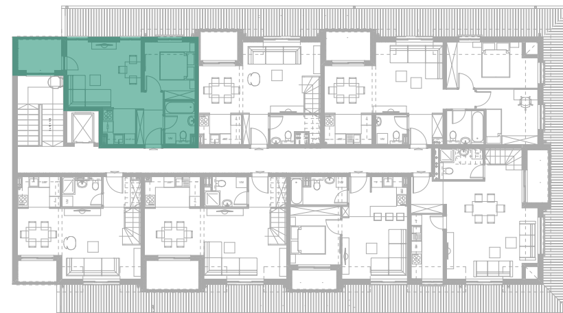
Položaj stana - POTKROVLJE prvi nivo