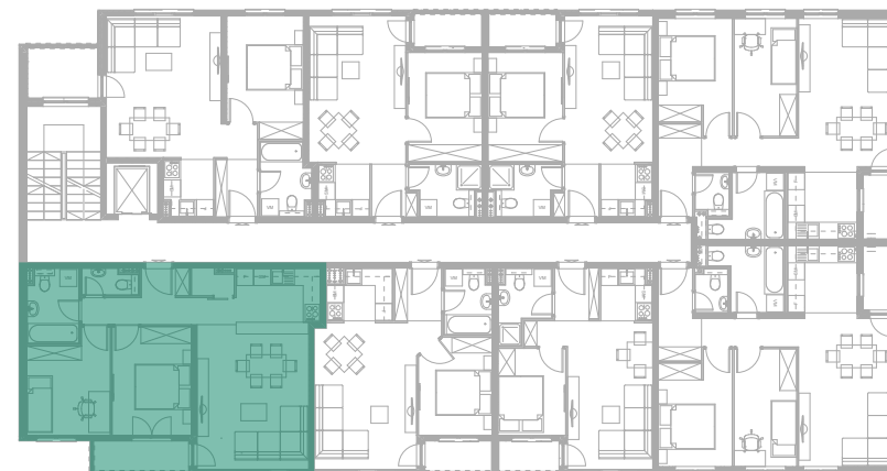
Položaj stana - IV SPRAT

investitor: INOBAČKA d.o.o. Novi Sad objekat: Stambena grada P+4+Pk(dupleks) lokacija: Bate Brkića 2A