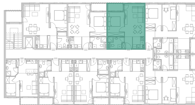
Položaj stana - I SPRAT