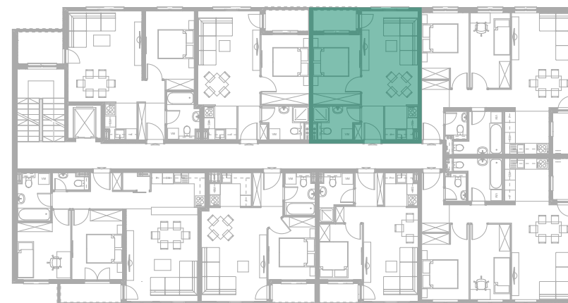
Položaj stana - IV SPRAT