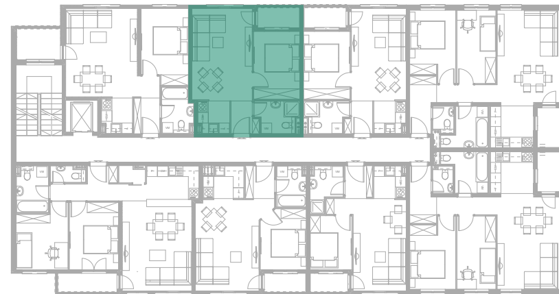
Položaj stana - IV SPRAT