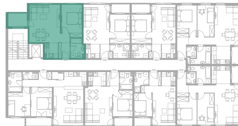
Položaj stana - IV SPRAT