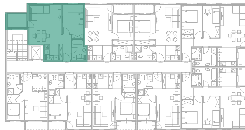
Položaj stana - II SPRAT