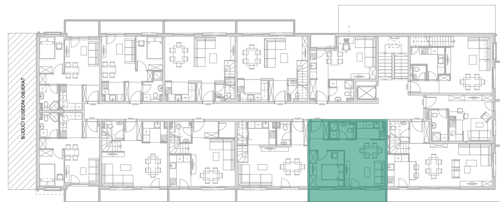
Položaj stana - potkrovlje donji nivo

investitor: INOBAČKA d.o.o. Novi Sad objekat: Stambena grada P+5+Pk(dupleks) lokacija: Bate Brkića 2