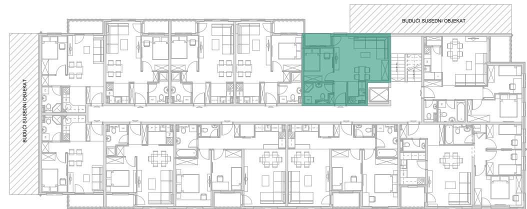
Položaj stana - V SPRAT