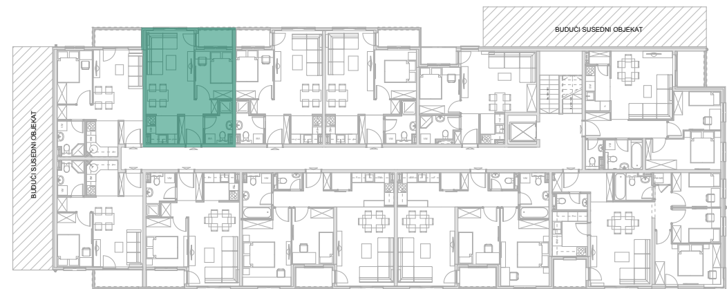
Položaj stana - V SPRAT