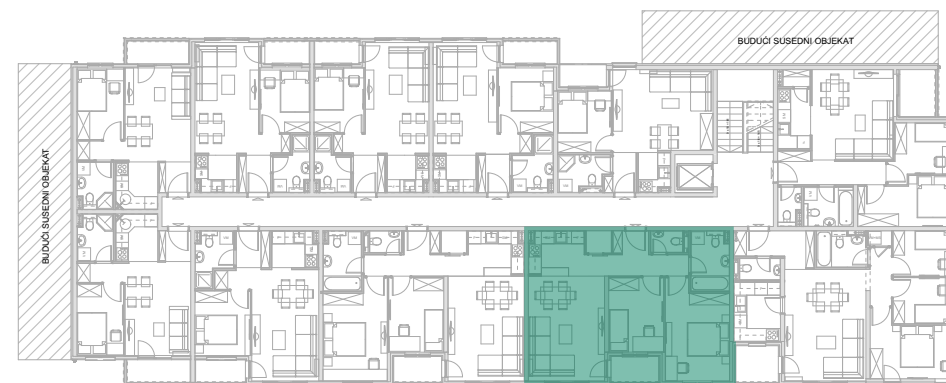
Položaj stana - II SPRAT

investitor: INOBAČKA d.o.o. Novi Sad objekat: Stambena grada P+5+Pk(dupleks) lokacija: Bate Brkića 2