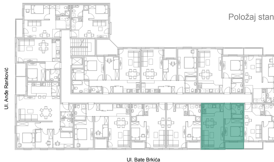
Ulica Bate Brkića